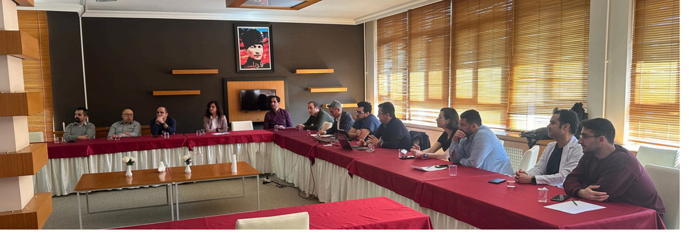
Fakültemiz tarafından 23.02.2024 tarihinde Sağlıkta Dijitalenme Toplantısı düzenlenmiştir. Emeği geçen hocalarımıza teşekkür ederiz.