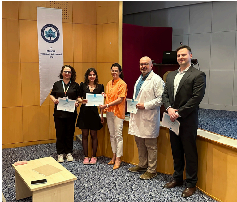
Fakültemizde 20.04.2024 tarihinde Olgu Panayırı düzenlenmiştir. Emegi geçen tüm hocalarımıza teşekkür ederiz.