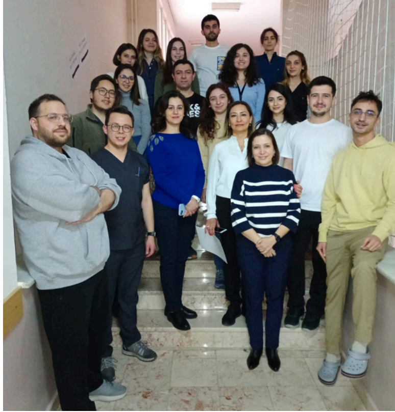
Fakültemiz tarafından 05 Mart 2024 tarihinde Erişkin İleri Yaşam Kursu düzenlenmiştir. Emeği geçen hocalarımıza teşekkür ederiz.