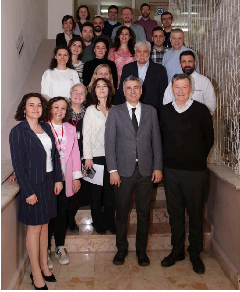
Fakültemiz Tıp Eğitimi Anabilim Dalı tarafından 26-28 Mart 2024 tarihlerinde Probleme Dayalı Öğretim Kursu düzenlenmiştir. Emegi geçen hocalarımıza teşekkür ederiz.