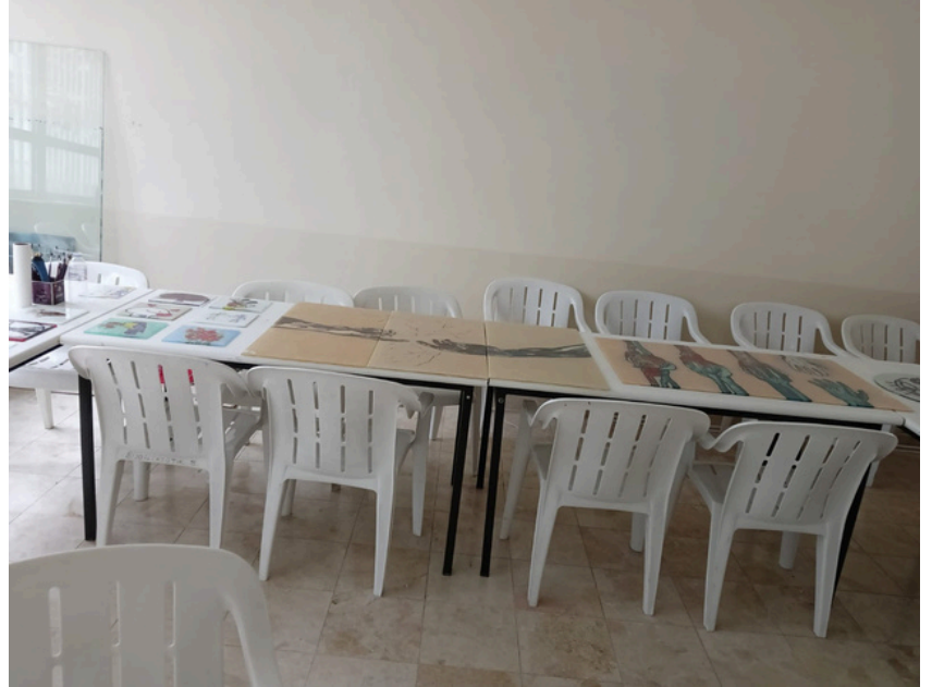
Fakültemiz cam dersliği ve malzemeleri yenilenmiştir.