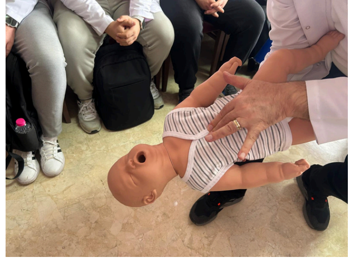
Fakültemiz Mesleki Beceriler Laboratuvarı maketleri sağlanan bağışla yenilenmiştir.