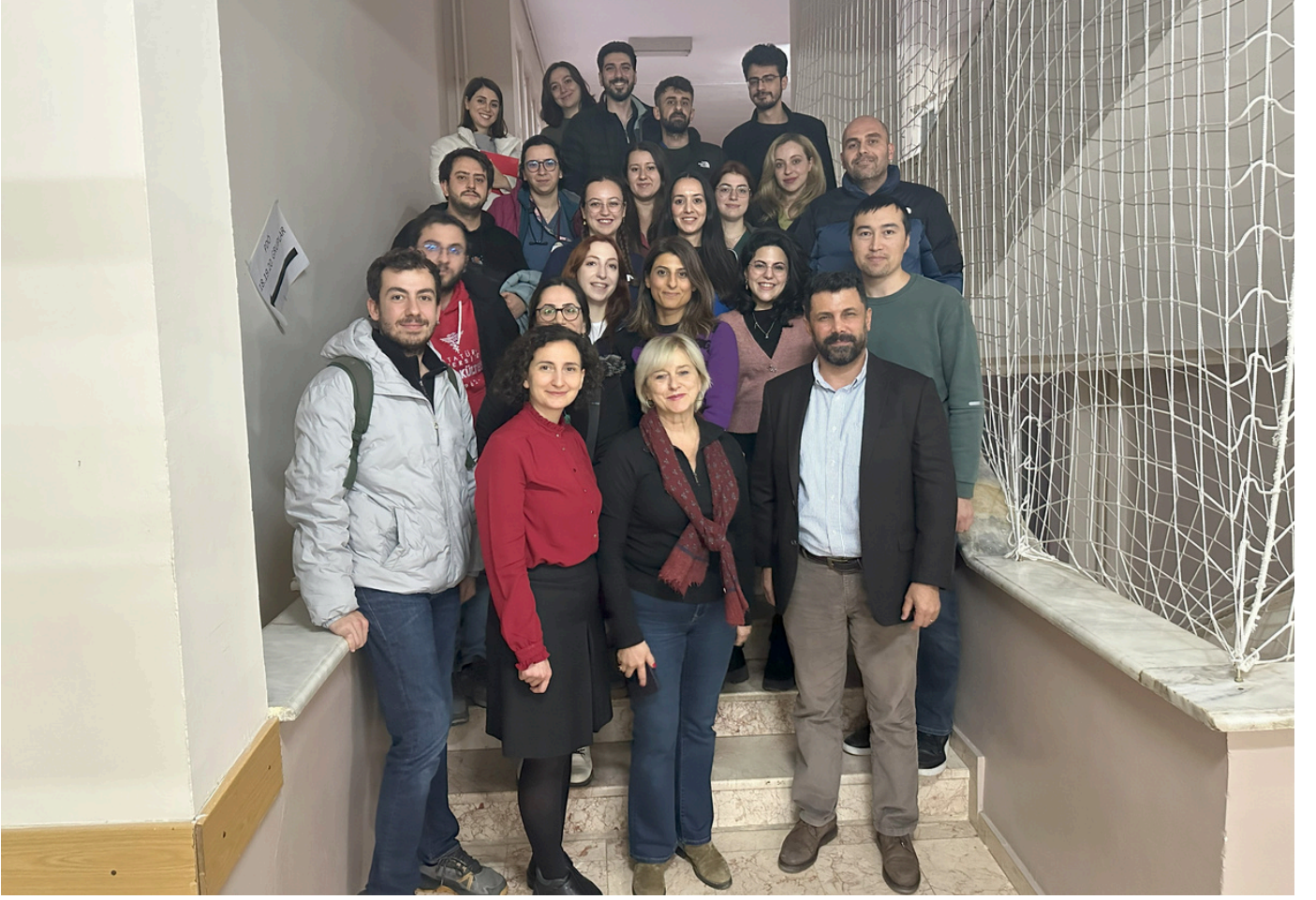
Fakültemizde 12.12.2024 tarihinde Neonatal Resüsitasyon Kursu düzenlenmiştir. Emęi geen hocalarımıza teřekkür ederiz.