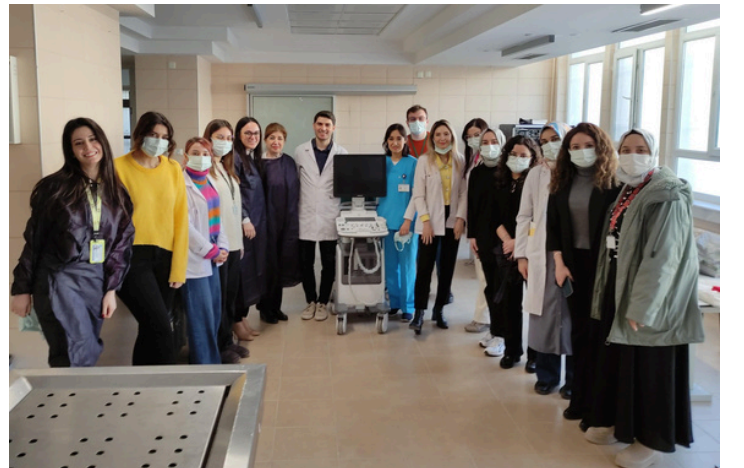
Fakültemizde 26.12.2024 tarihinde Kadavra Üzerinden Ultrason Kursu düzenlenmiştir. Emęi geen tüm hocalarımıza teřekkür ederiz.