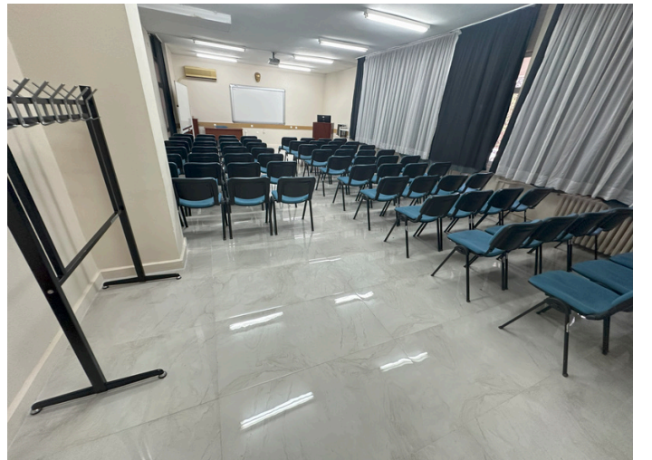
Fakültemiz Dahiliye ve PDÖ (Probleme Dayalı Öğrenim) derslikleri zeminleri yenilenmiştir.