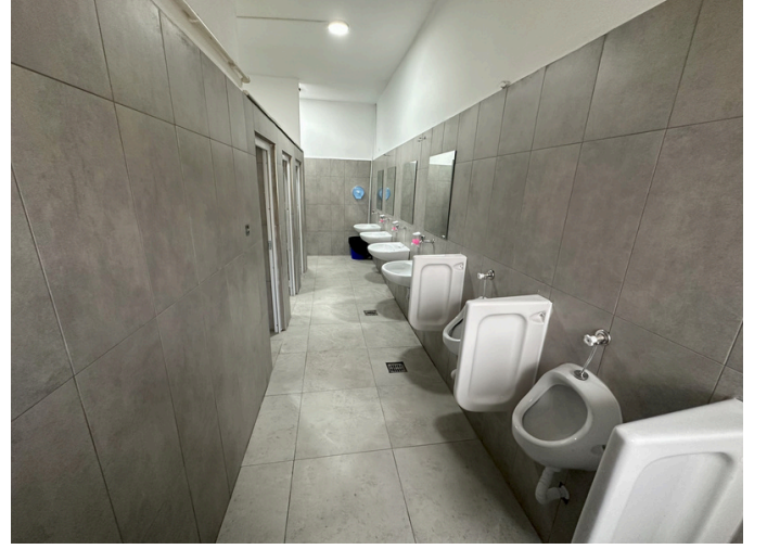
Fakültemiz merkezi derslikleri lavabo ve tuvaletleri yenilenmiştir.